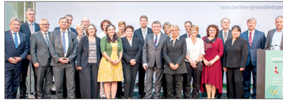
Bundesgesundheitsminister Hermann Gröhe (Bildmitte vorn) mit allen Gewinnern des „Berliner Gesundheitspreises 2015“.

An dem Wettbewerb von AOK-Bundesverband, Ärztekammer Berlin und AOK Nordost nahmen insgesamt 53 Einrichtungen teil. Thema des 10. Wettbewerbs: „ Zusammenspiel als Chance – Interprofessionelle Teams im Krankenhaus “. Zunehmende Spezialisierung ermögliche zwar eine hochwertige Versorgung, stelle aber gleichzeitig besondere Anforderungen an die Zusammenarbeit der Berufsgruppen, betonte Bundesgesundheitsminister Hermann Gröhe (CDU) bei der Preisverleihung am 18. Juni. Mit dem 1. Preis zeichnete wurde das „Weddinger Modell“ ausgezeichnet. Die Klinik im Berliner Stadtbezirk Mitte arbeitet seit 2010